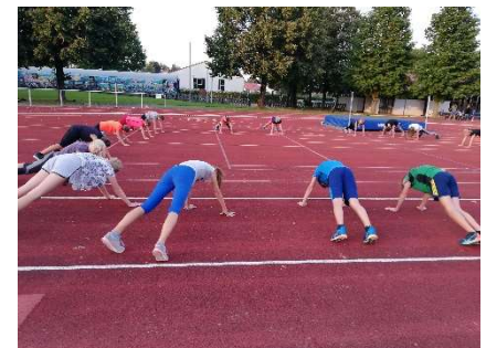
Gymnastik auf dem Sportplatz